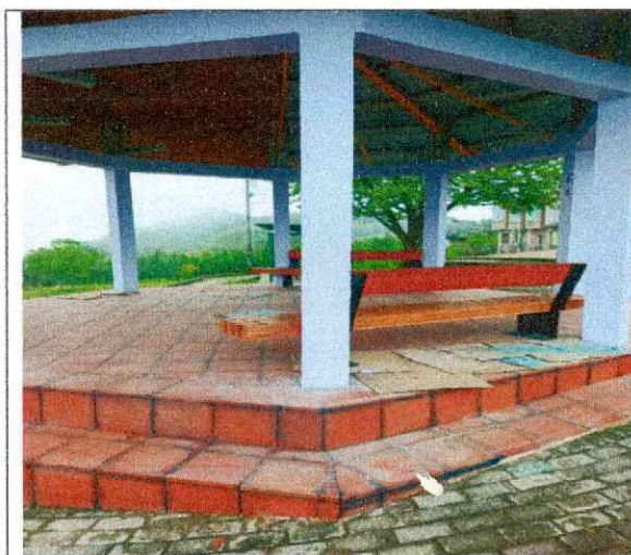
NOTE 40 Pro