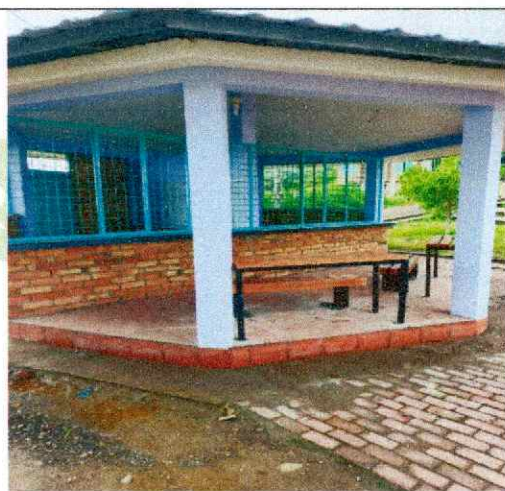
NOTE 40 Pro